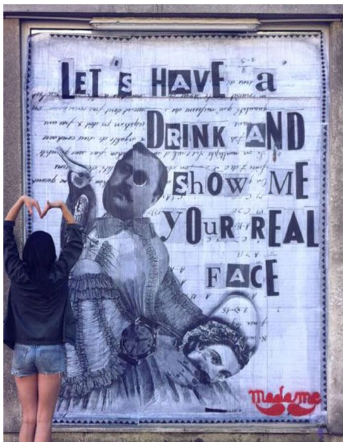
Madame – street paste up, Paris, France.

"La street art dalla pelosità sovrasviluppata (!) ci offre una bella collezione dei suoi collage elaborati con un incredibile maestria. In essi si stagliano personaggi fantastici e una tipografia alla 'corvo' per esprimere le parole giuste. Provocazioni. Finalmente un po' di trash in questo mondo così asettico".