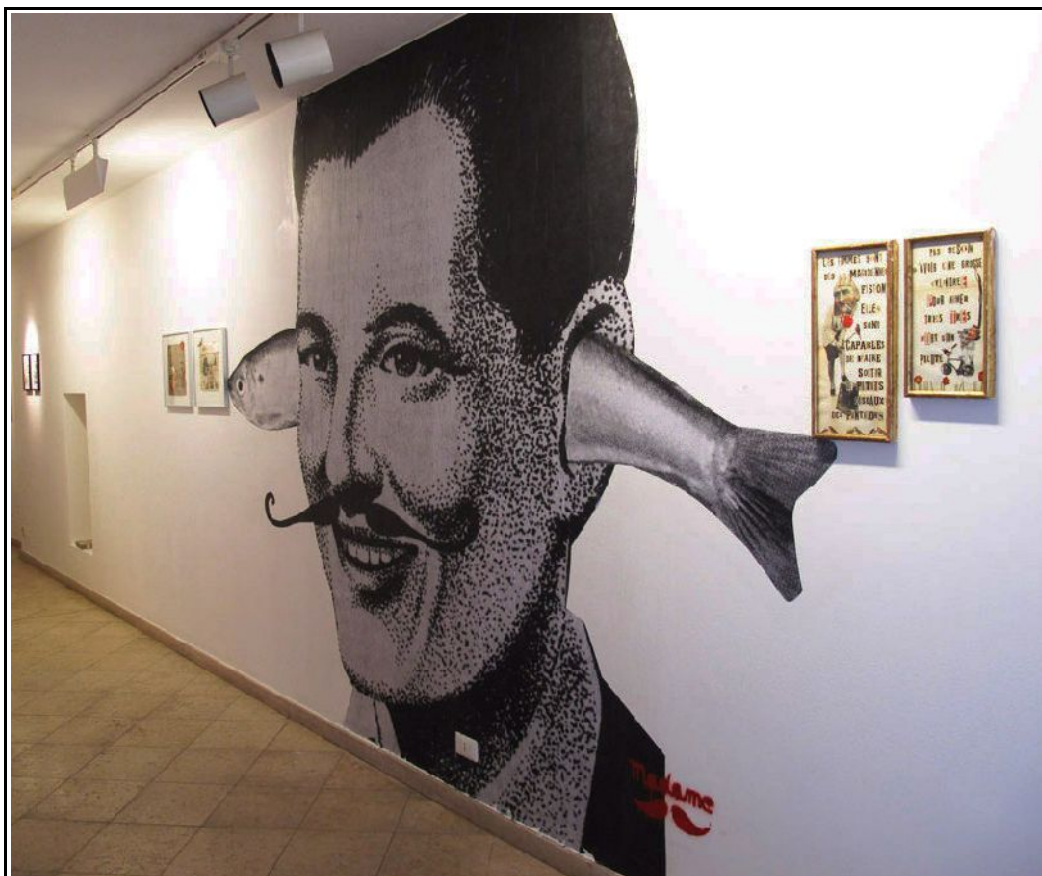
View Installation by Madame at Traffic Gallery 2014

Contemporary Art | Via San Tomaso 92 | Bergamo