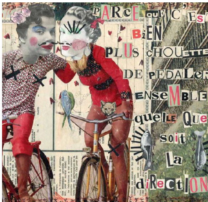
Madame – private collection, Italy.

"L'erotismo leggiadro delle creazioni di Madame è la prima scintilla che cattura lo sguardo del passante urbano. Il détournement di queste immagini assegna loro un messaggio contestatario. Al di là dello scherzo e della provocazione, le sue opere detengono un senso più profondo della loro apparenza. Tramite un'evocazione nostalgica, esse sostengono la tolleranza, l'amore e la reciprocità nei rapporti umani. La sua ironia verso le convenzioni sociali risveglia lo spirito infantile che aleggia in ciascuno di noi. Madame fa prova di una stravaganza gioiosa senza privarsi di un certo piacere della sovversione".