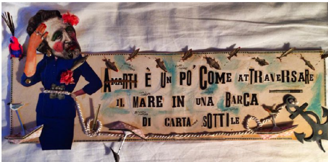
Madame – New Works for Traffic Gallery, Collage Mixed Media, pièce unique, 2014.

Gioia Tragica (Milano 2010, Parigi 2011, Barcellona 2012).