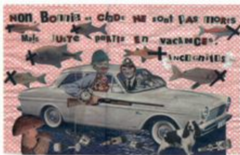
Bonnie and Clyde 2012 tecnica mista su legno dipinto 49,5 x 75 cm

La voglia principale che trasmetto in questo lavoro è di richiamare l'attenzione della gente, degli spettatori, in un primo momento per farli ridere e poi, in un secondo momento, per farli pensare al modo d'interpretare l'immagine che io gli prospetto. Le mie composizioni, usando vecchia carta, oggetti e foto del passato, si ricollegano alla memoria comune e alla nostalgia d'ognuno di noi. La mia poetica si dibatte tra i temi dell'amore, della ricerca dell'amore e soprattutto della mancanza dell'amore. È una poetica che più ampiamente riguarda i "rapporti" animali, umani, sentimentali... M'interessa poi la prossimità dell'uomo con l'animale tra pulsioni e sentimenti.