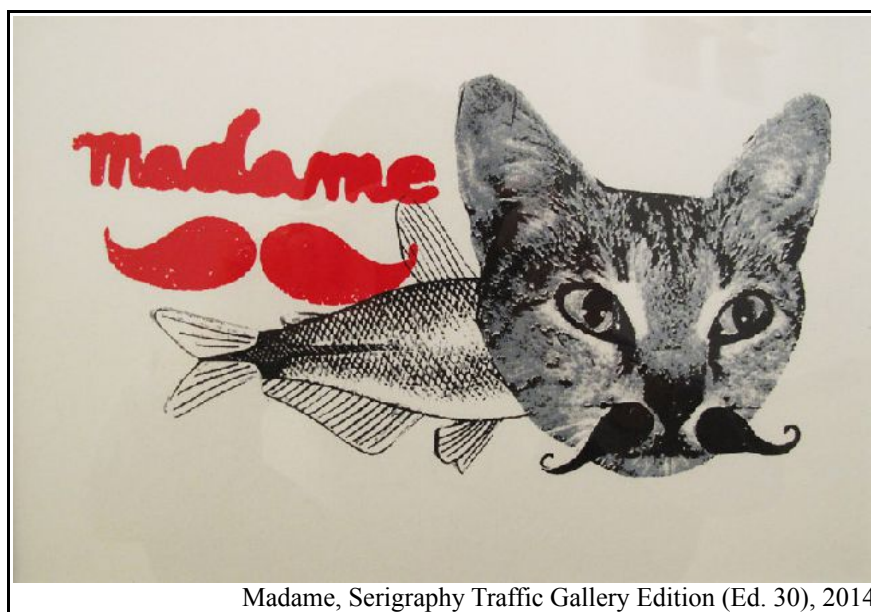
Madame, Serigraphy Traffic Gallery Edition (Ed. 30), 2014