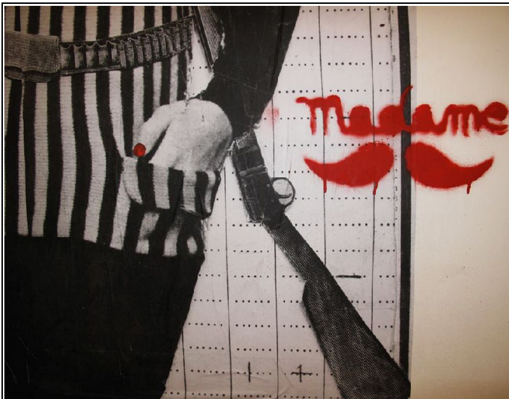
View Installation by Madame - Detail at Traffic Gallery 2014

| 08 February - 30 April 2014 | Opening Saturday 08 February 2014 time 19.00 - 21.30