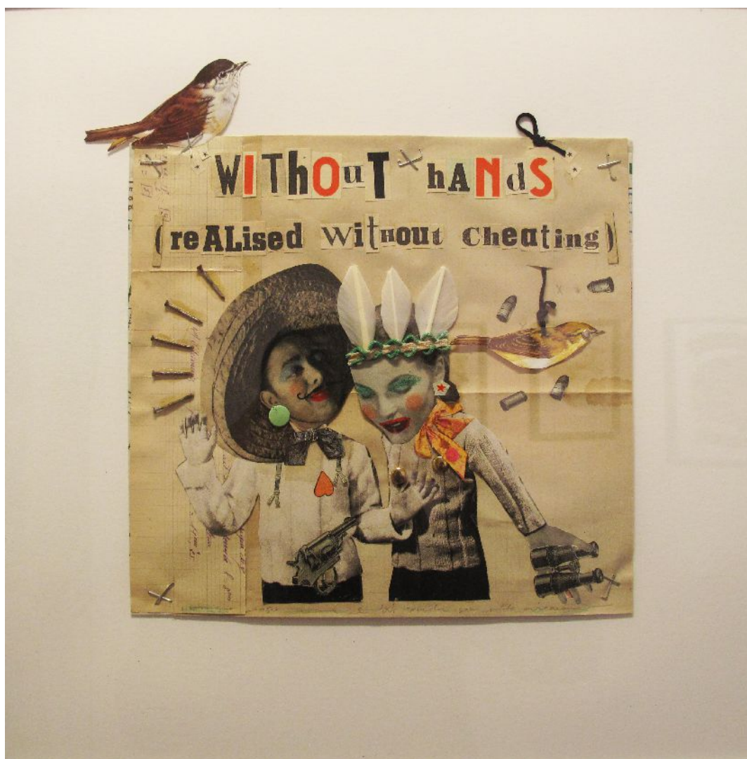
Madame – New Works for Traffic Gallery, Collage Mixed Media, 40x40cm, pièce unique, 2014.

Contemporary Art | Via San Tomaso 92 | Bergamo